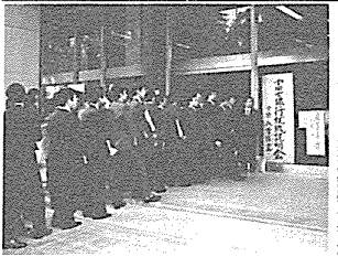
納得よく就職を済めて

就職課の業務は、就職活動の支援、就職情報の提供、就職相談の受付、就職面接の調整、就職書類の送付、就職結果の通知、就職後のフォローアップなど、多岐にわたります。就職課は、学生の就職活動を円滑に進め、就職率を向上させるために、日々努めています。 就職活動は、学生にとって重要な人生の岐路です。就職課は、学生の就職活動を支援するために、就職情報の提供、就職相談の受付、就職面接の調整、就職書類の送付、就職結果の通知、就職後のフォローアップなど、多岐にわたります。 就職課は、学生の就職活動を支援するために、就職情報の提供、就職相談の受付、就職面接の調整、就職書類の送付、就職結果の通知、就職後のフォローアップなど、多岐にわたります。