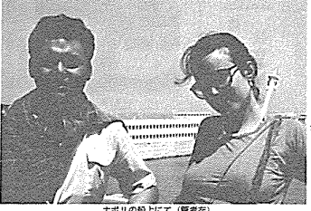
ナボリの船上にて(観客在)

恋の心理、恋愛のテクニック、恋愛の悩みなどについて、関の著書を紹介。恋の心理、恋愛のテクニック、恋愛の悩みなどについて、関の著書を紹介。 恋の心理、恋愛のテクニック、恋愛の悩みなどについて、関の著書を紹介。恋の心理、恋愛のテクニック、恋愛の悩みなどについて、関の著書を紹介。